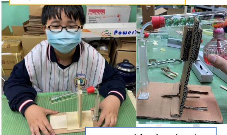
簡易史特林機製作